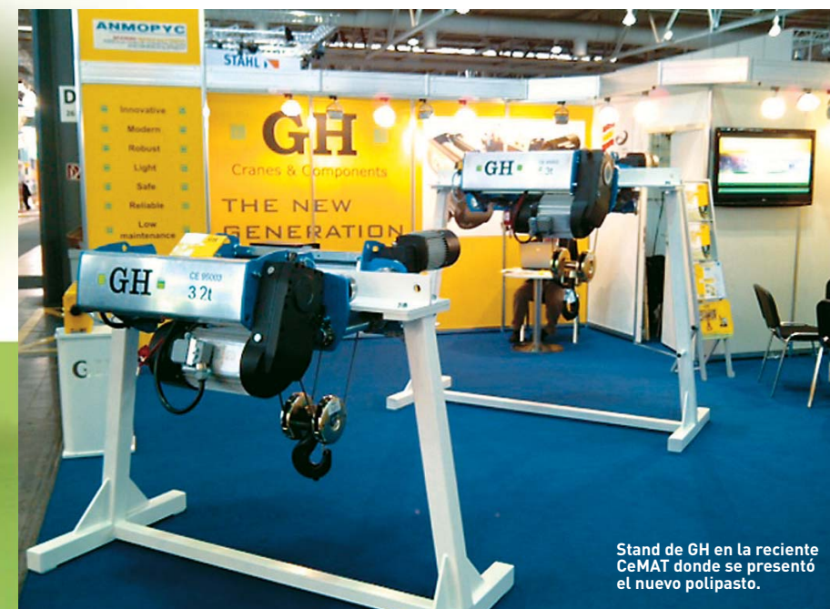
Stand de GH en la reciente CeMAT donde se presentó el nuevo polipasto.

For example, the fact that it has been possible to fit a timer, a cycle counting device, or a load cell. Now we can also include an affordable standard series lifting apparatus.