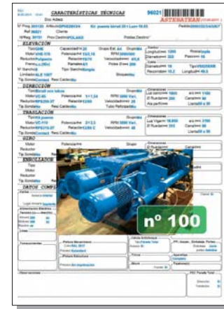
Hoja de características del polipasto número 100.

Mejorar nuestra competitividad mejora la de nuestras filiales y clientes. Este es el camino y ésta es nuestra oportunidad.