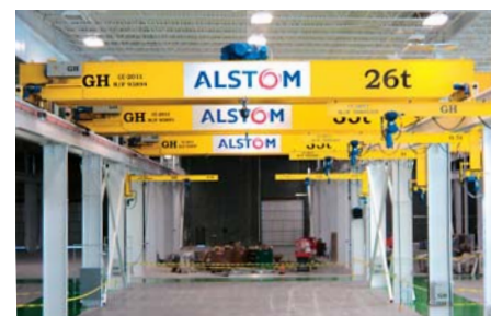
Instalación de ALSTOM en Amarillo (Texas) gestionada desde México.

En el área de influencia de México, en donde se ha desarrollado una amplia red comercial dirigida desde nuestra filial en el país azteca, destacan los siguientes proyectos: