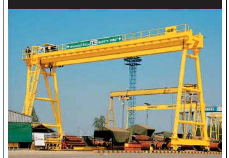
Proyecto en el Astillero CUEL de Bangkok.